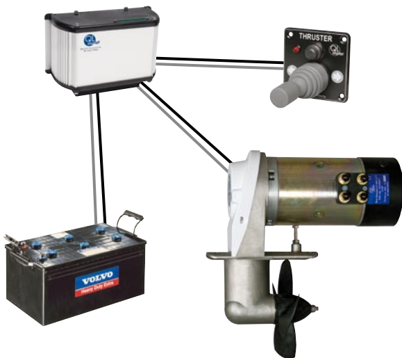
Unité de commande