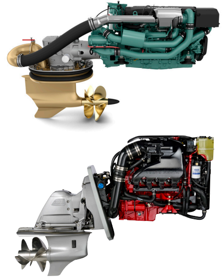
延长质保计划 涵盖在休闲领域使用的所有柴油和汽油推进包。